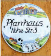
Pfarramt Sonneborn Tel.: 036254 | 71471 kirchspiel.sonneborn@gmx. de Vakanz